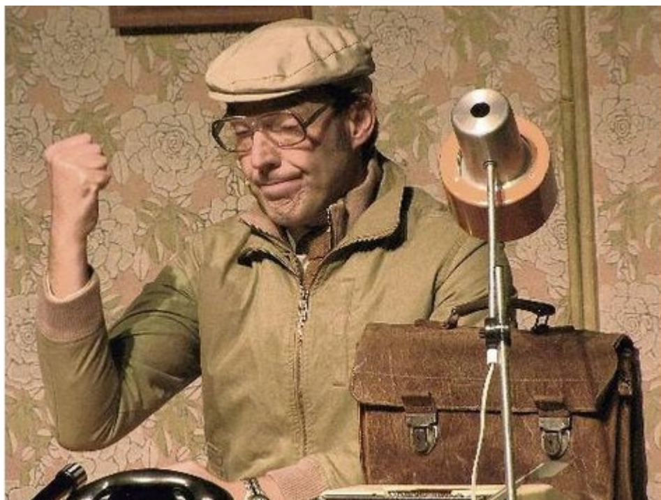
„Baumann & Clausen“ begeisterten am Freitagabend das Publikum im Nienburger Theater auf dem Hornwerk

Nienburg - Von Kurt Henschel · Feinste Unterhaltung mit hohem Lach- und Entspannungs-Faktor am Ende einer Arbeitswoche boten am Freitagabend in Nienburg „Deutschland beliebteste Beamte“: „Baumann & Clausen“ gastierten vor gut 500 Zuschauern im Theater auf dem Hornwerk und erfüllten dort auch einen „Bildungs-Auftrag“. Ihr Programm mit dem Titel „Die Wende in 90 Minuten“ zeigte auf, was sich unmittelbar vor und auch nach der Wiedervereinigung Deutschlands ereignete.